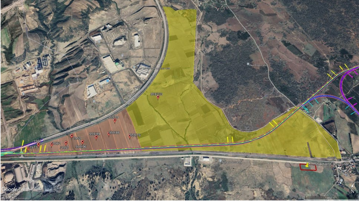
Şekil 1. Proje Alanının ve Etkilenen Parsellerin Coğrafi Dağılımı

Ayrıca, proje alanının coğrafi dağılımı ile bu Zeyilname için yapılacak ek değerlendirmeye konu olan parseller, Şekil 1'de yer alan bir konum haritası aracılığıyla sunulmaktadır.