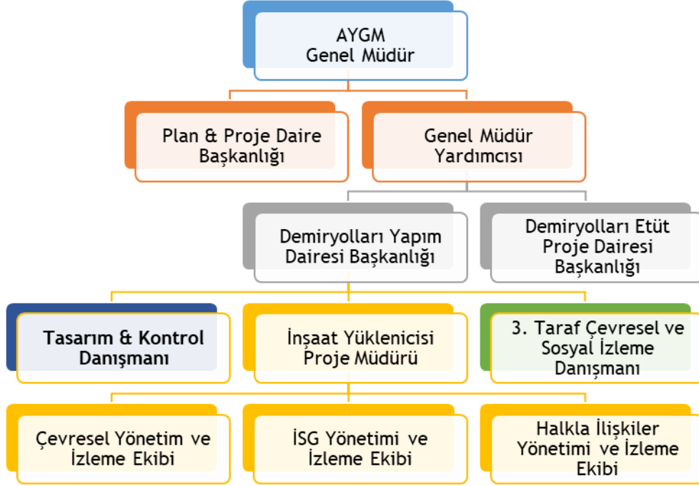
Şekil 5-1: ÇSYS Organizasyon Yapısı

Projenin yapımı tamamlandıktan sonra Türkiye Cumhuriyeti Devlet Demiryolları İşletmesi (TCDD) Genel Müdürlüğü'ne devredilecektir. TCDD Genel Müdürlüğü, demiryolu yönetimi kapsamında, Projeyi kendi çevresel ve sosyal yönetim sistemine dâhil edecektir.